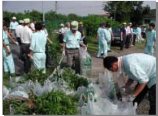
事業者による地域清掃活動の様子