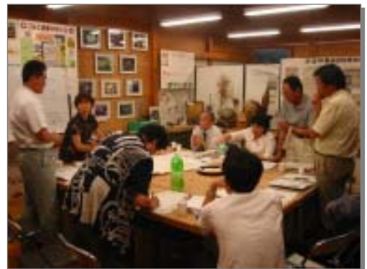
コミュニティ分科会の様子