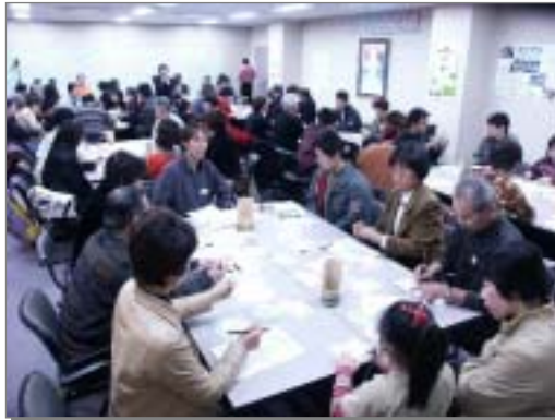
市民に呼びかけ環境を話し合った「かんきょう談話会」の様子

事業所における環境改善委員会の設置促進、事業所における環境学習の推進、事業者の環境まちづくりに取り組む人材育成事業者間ネットワークの構築、事業者も参加するエコマネー制度の導入、ISO取得の支援、低金利で貸し付けるエコバンク 46 の創設、事業者参加の市民会議の設置