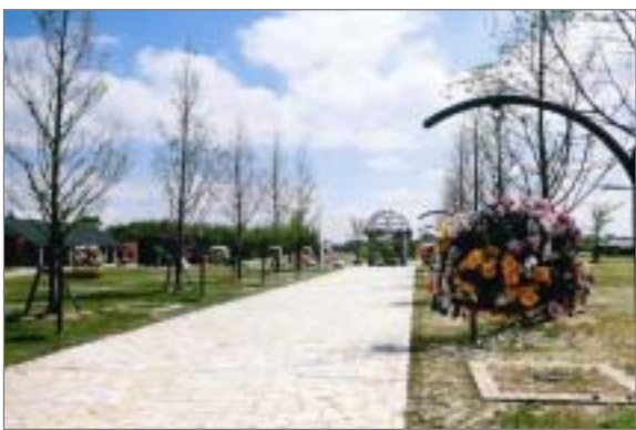
ため池も活用した野方三ツ池公園

地区計画による地域のまちづくりの推進、すぐれた景観のPR、歴史・文化を感じられる建物等百選の実施、景観基本計画の策定 細い路地など歴史を感じる昔ながらのまちなみの保存・活用・PR、史跡や文化財の保存