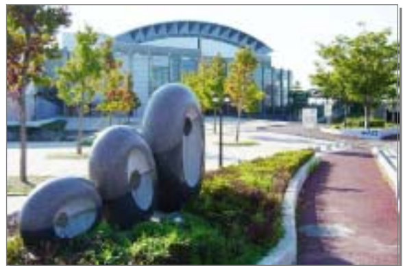
市の中心部にあるスポーツセンター