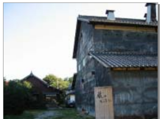
赤池のみそ蔵を活用したギャラリー