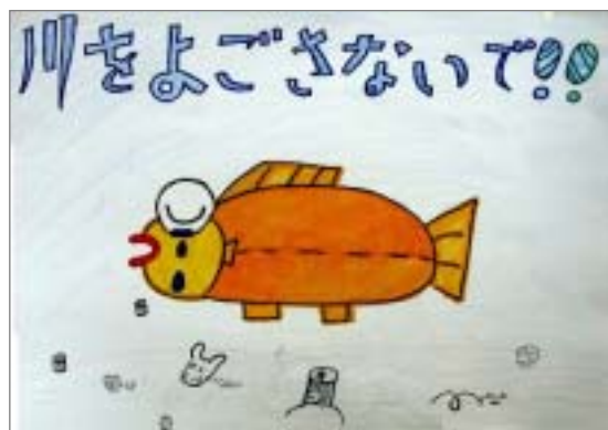
こどもプロジェクト「ミラクルフラワーキッズ」による川の自然愛護を呼びかけるポスター