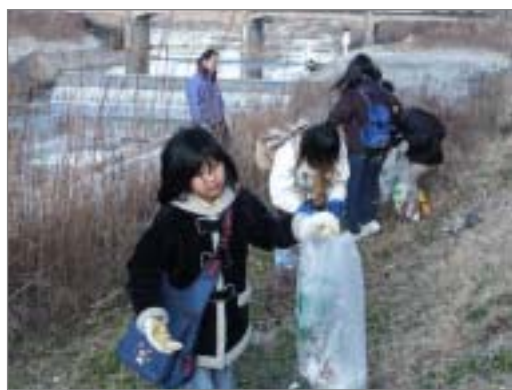
こどもプロジェクト「ミラクルフラワーキッズ」によるごみ拾い大会の様子