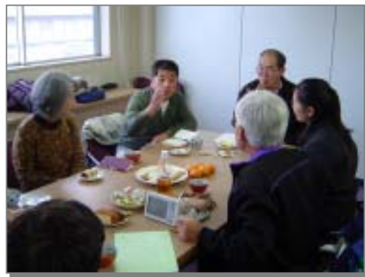
地球温暖化対策モニター交流会の様子