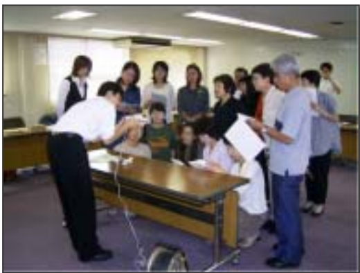
地球温暖化対策モニター説明会の様子