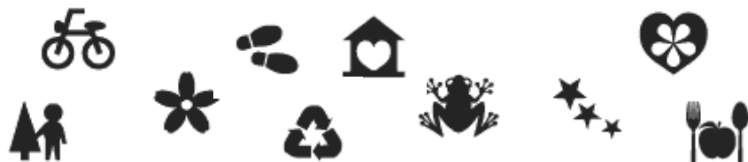
世界共通のグリーンマップアイコン(絵記号)の例

A: 市民主体・行政共働 / B: 行政主体・市民参加 17-20 H.16 21-25 年度