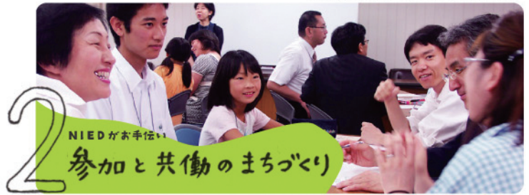
▲ 環境をよりよくしたい市民リーダーの環境講座