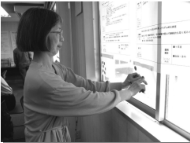
参加したいプロジェクトに投票する様子

事前に希望を聞いていた当日欠席者も含め、リーダーがいて、市民ネット・まち研メンバーがともに一人でもいれば、今年度、重点プロジェクトとして取り組むことが決まります。条件を満たさなかったプロジェクトについては、シールを貼った人同士で調整し、プロジェクトの成立を目指しました。