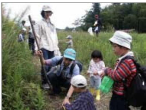
秋の野山を遊び尽くそう！の様子（東部丘陵）