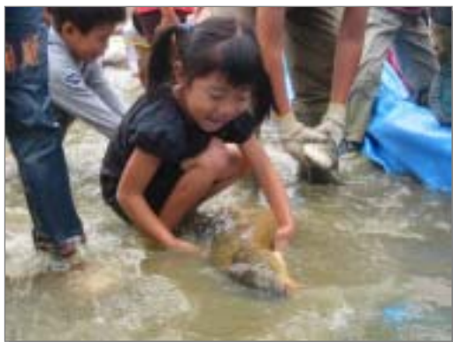
堀割池での池殺生の様子（赤池町）

自然遊びの達人の発掘と活用、里山ボランティアの育成、日進独自の絵本・紙芝居・写真集・図鑑などの作成