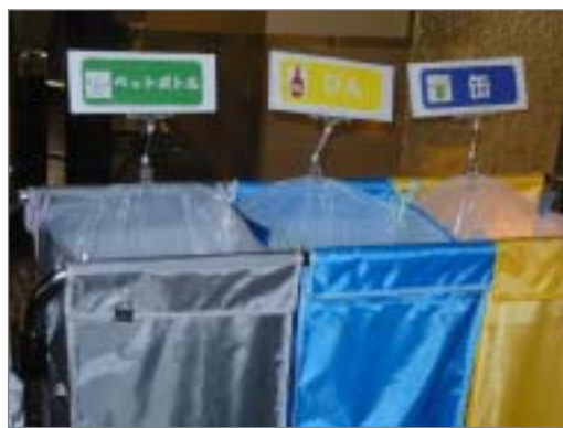
市役所での環境配慮活動の様子