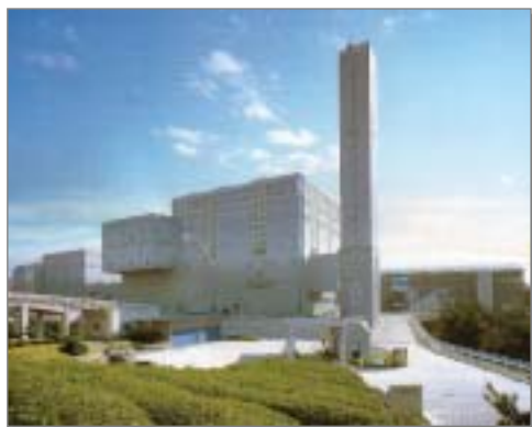
環境対策が施された東郷美化センター

I S O取得の支援、事業所における環境改善委員会の設置促進、事業所における環境学習の推進