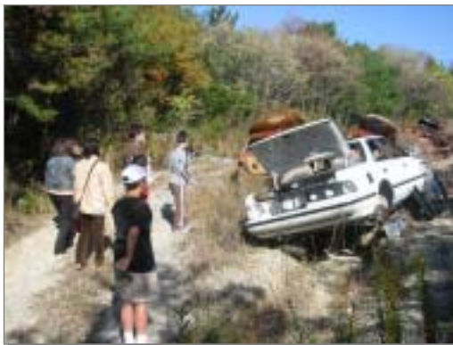
こどもプロジェクト「デリートカップパーズ」による不法投棄現場調査

フロンの確実な回収、ノンフロン化の推進 地球温暖化防止の観点からの緑地の位置づけと保全、地球環境問題に対する適切な対応策の検討