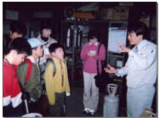
こどもプロジェクト「調べ隊」によるフロン回収工場の見学