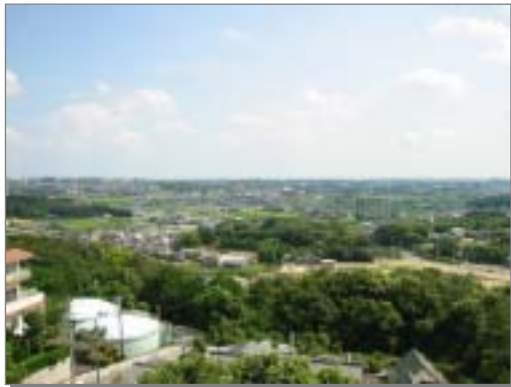
平成展望台から見る市中央部の風景

沿線住民の落葉・日照・害虫の理解協力要請、ライオンズクラブ・ロータリークラブなど事業者団体や市民からの寄付制度、植栽可能路線の調査、植栽実施計画の立案（植栽樹種、植栽地域、管理者（国・県）の調整、市民ボランティアによる管理委託（アダプトプログラム制度の導入）、愛称募集（並木） 河川への植栽方法の検討、天白川沿いの散策コースとポケットパークの整備